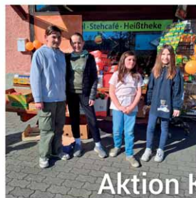
Aktion Kilo 2024

Es kam einiges zusammen. Mitarbeiter des Caritasverbandes im Dekanat haben die Kisten abgeholt. Diese werden an Bedürftige verteilt.