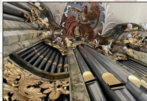
Orgel von St. Jakobus

Daneben freuen wir uns, wenn Sie die Kirchenmusik auch finanziell mit einer freiwilligen Spende unterstützen.