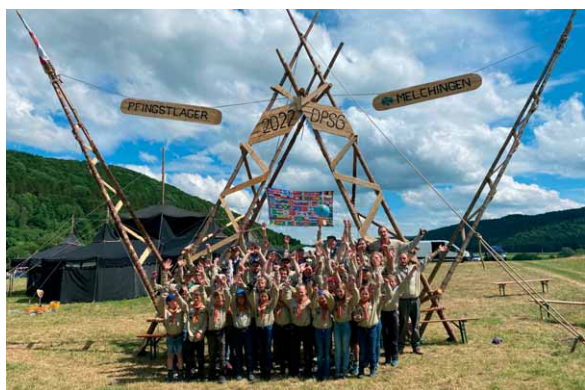
(Der Stamm DPSG Pfullendorf vor dem Lagertor)