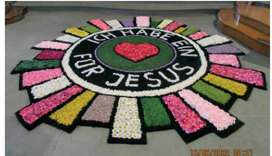
Blumenteppich in St. Jakobus