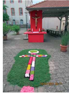
Blumenteppich am Pflegeheim