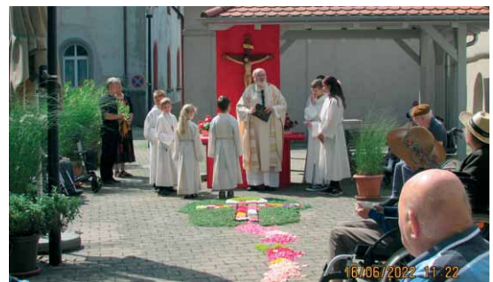
Prozession am spitälischen Pflegeheim