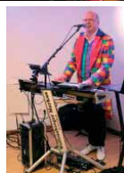
Bilder und Text: Christine Haug